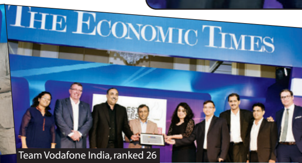
Team Vodafone India, ranked 26