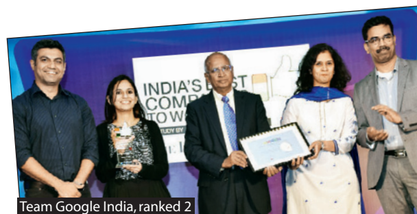
Team Google India, ranked 2

"Having partnered with The Great Place to Work Institute in 2007, we have been doing this for seven to eight years now and we've found that the best companies to work for are those that can harness talent better than their competitors. The leadership, culture and systems and processes that drive that culture; these are the factors that make a difference. I'm really happy to see that all the CEOs and HR heads have come along with their teams to receive these awards."