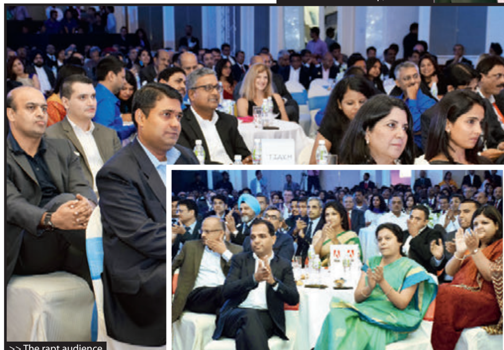
>> The rapt audience

People inherently want to feel involved in their work"