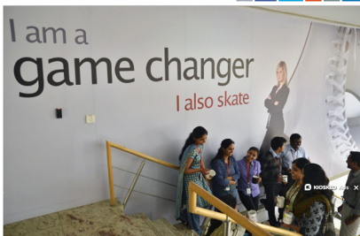
Employees at an IT firm in Bangalore [Representation Image]

Domestic IT firm RMSI has pushed Google India to the second spot to emerge as the country's best company to work for in 2015, according to a study.