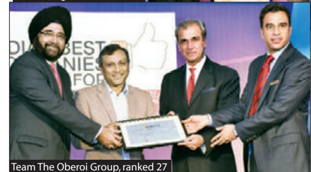
Team The Oberoi Group, ranked 27