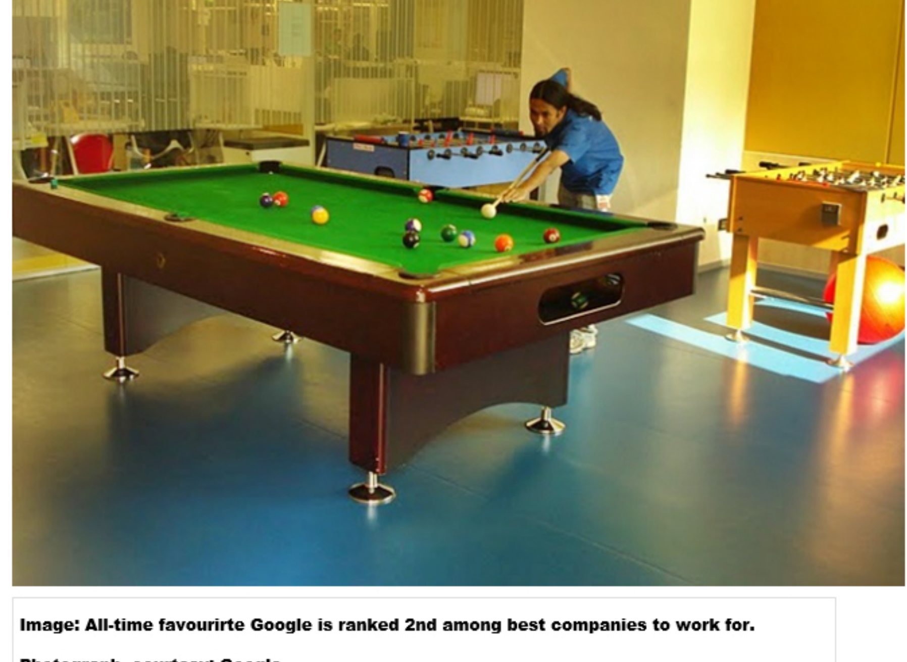
Image: All-time favourite Google is ranked 2nd among best companies to work for.

Even high-paid employees agree that money does not matter after a certain point, it is job satisfaction and a cordial office atmosphere that ultimately makes a difference.