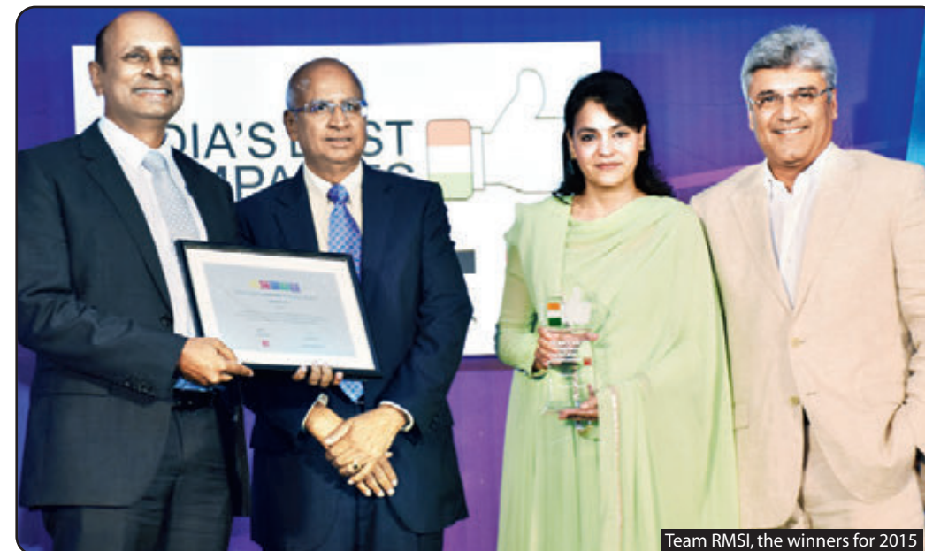
Team RMSI, the winners for 2015

Thus the event served as a great platform to recognise companies which are going the extra mile for their employees.